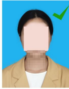
着正装、头发扎起来效果