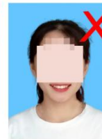
嘴唇闭合,不能露牙